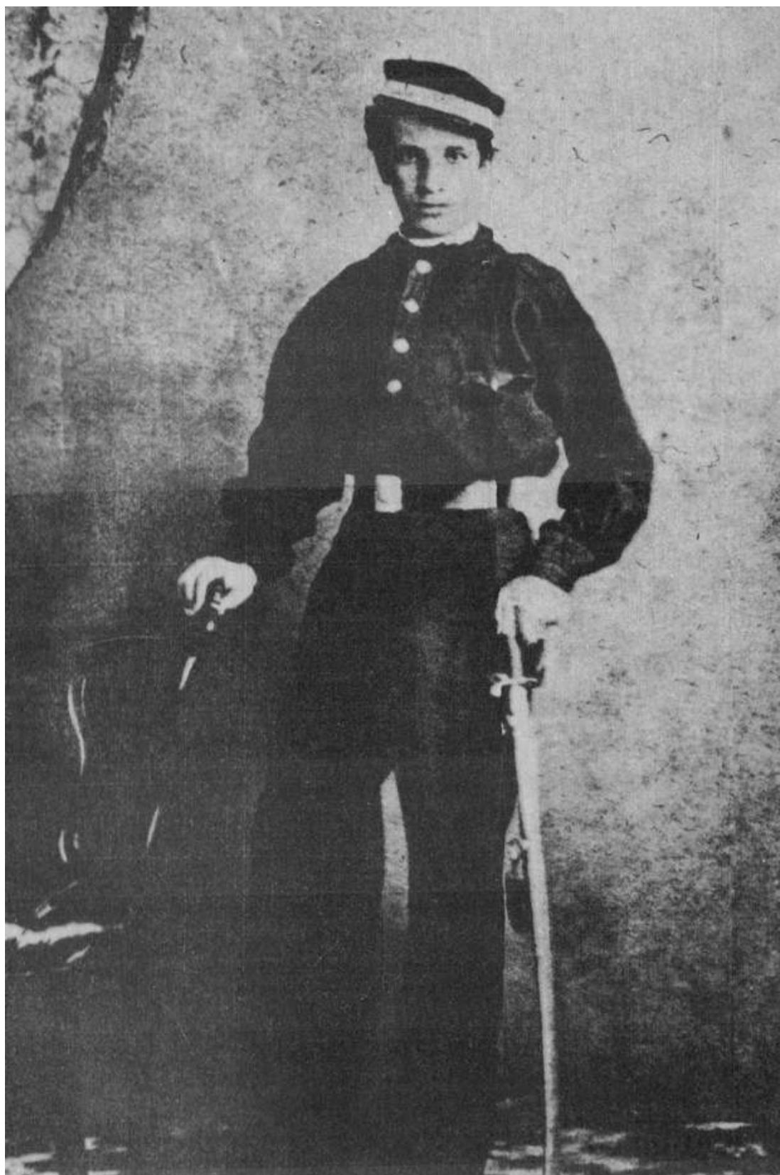
Retrato del Capitán Sarmiento en las vísperas de Curupaity